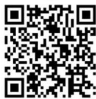
高中資訊營FB粉絲專頁

參與對象及名額: 對「 電腦應用、新興資訊技術 」有興趣之高中職學生, 名額60人(依據報名順序為錄取標準, 額滿為止)。全程參與者將核發證書 乙份 。