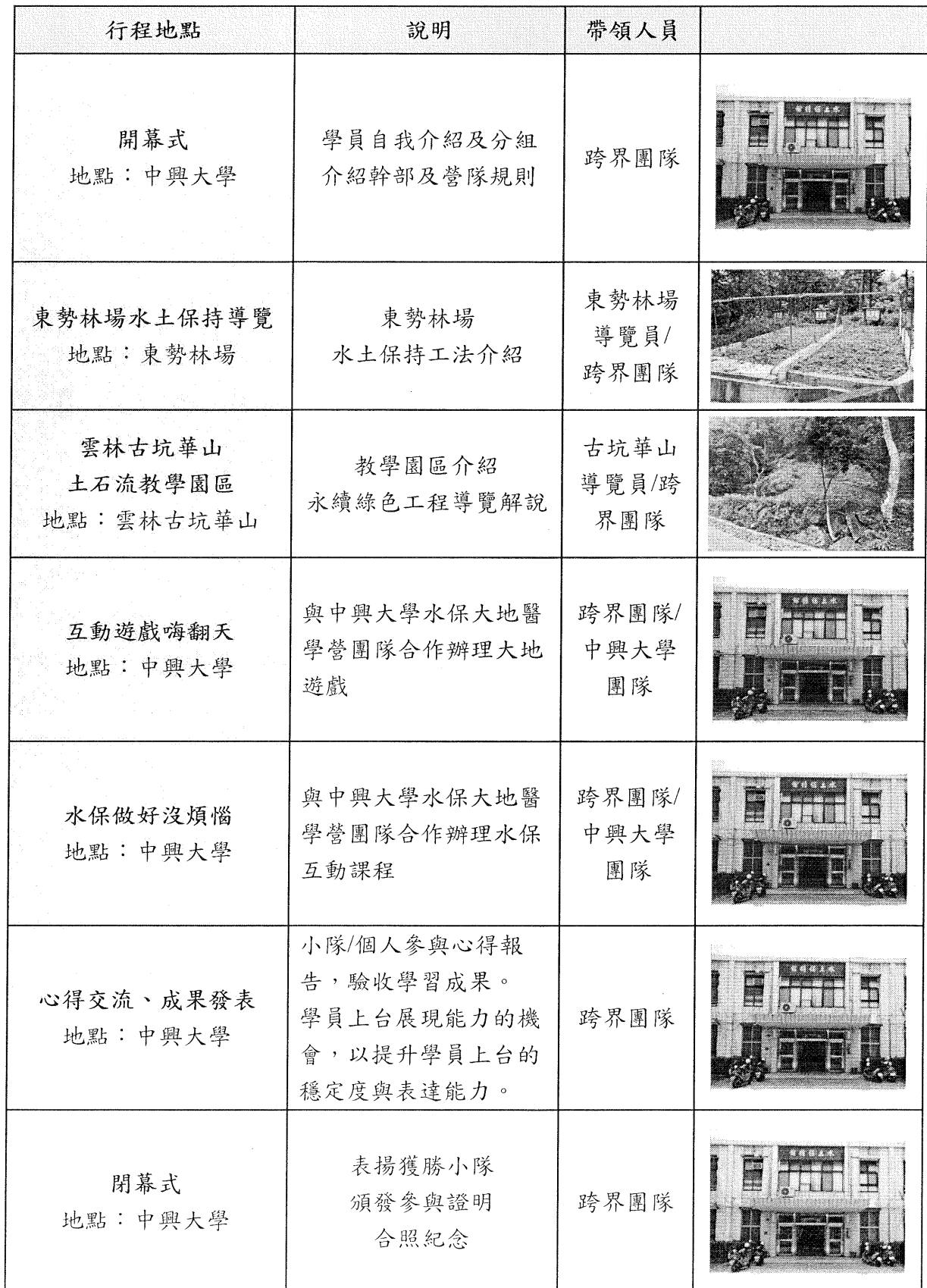
表 2 營隊行程內容說明