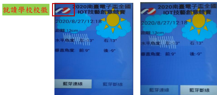
圖 2、手機顯示畫面，左-藍牙連線、右-藍牙斷線的功能選項[顯示畫面為參考用]