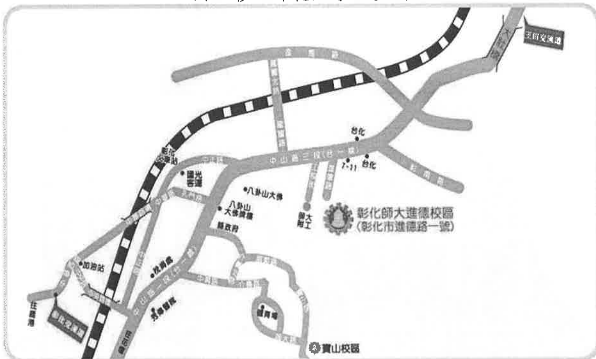
國立彰化師範大學位置圖