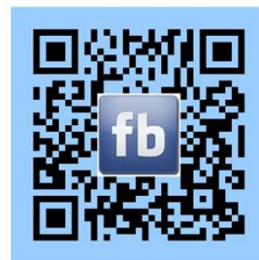
臺中市東區戶政所粉絲專頁