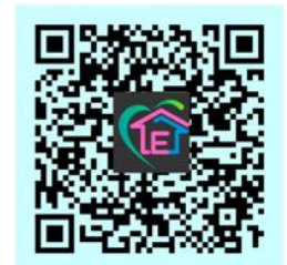
臺中市東區戶政事務所官網