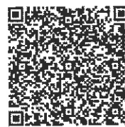
105 年度社工人身安全及社會工作專業發展 共識營報名表