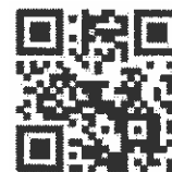
105年度社工人身安全及社會工作專業發展 共識營FB粉絲專頁