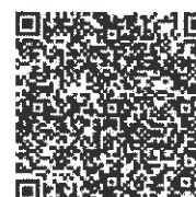
105年度社工人身安全及社會工作專業發展 共識營報名表