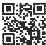
105 年度社工人身安全及社會工作專業發展 共識營 FB 粉絲專頁