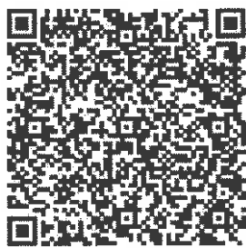
105年度社工人身安全及社會工作專業發展 共識營報名表