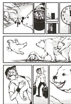
一般組(故事漫畫)主題自訂 作品名:You are my best gift 筆名:Akimichi(俄羅斯)