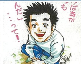
草花里樹 Kusaka Riki

2003 年時以「Volatile (ホラーテイブル) (講談社) 出道。代表作為「學執化解師 - 示談交渉人 白井虎次郎 (ゴタ消し - 示談交渉人 白井虎次郎-)」(集英社) 等。