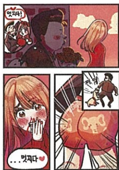
高中組「真棒！」 作品名:帥氣內褲 筆名:遊人(韓國)