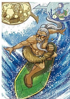
一般組(1頁漫畫)「東山再起」 作品名:TARO URASHIMA 筆名:Kitaoka Mitsuru (日本)