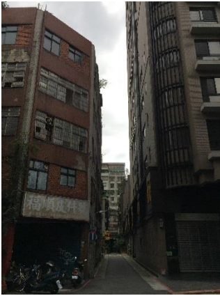
基地側巷建築物現況照片