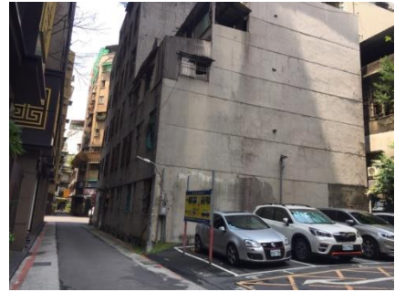
基地後巷建築物現況照片