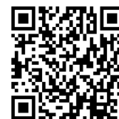
木匠的家粉絲專頁

加入木匠的家粉絲專頁追蹤最新消息： https://www.facebook.com/theCarpentersCoffeeBar/