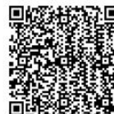
怡仁基金會粉絲專頁

加入怡仁愛心基金會粉絲專頁追蹤最新消息： https://www.facebook.com/yijen02488772/