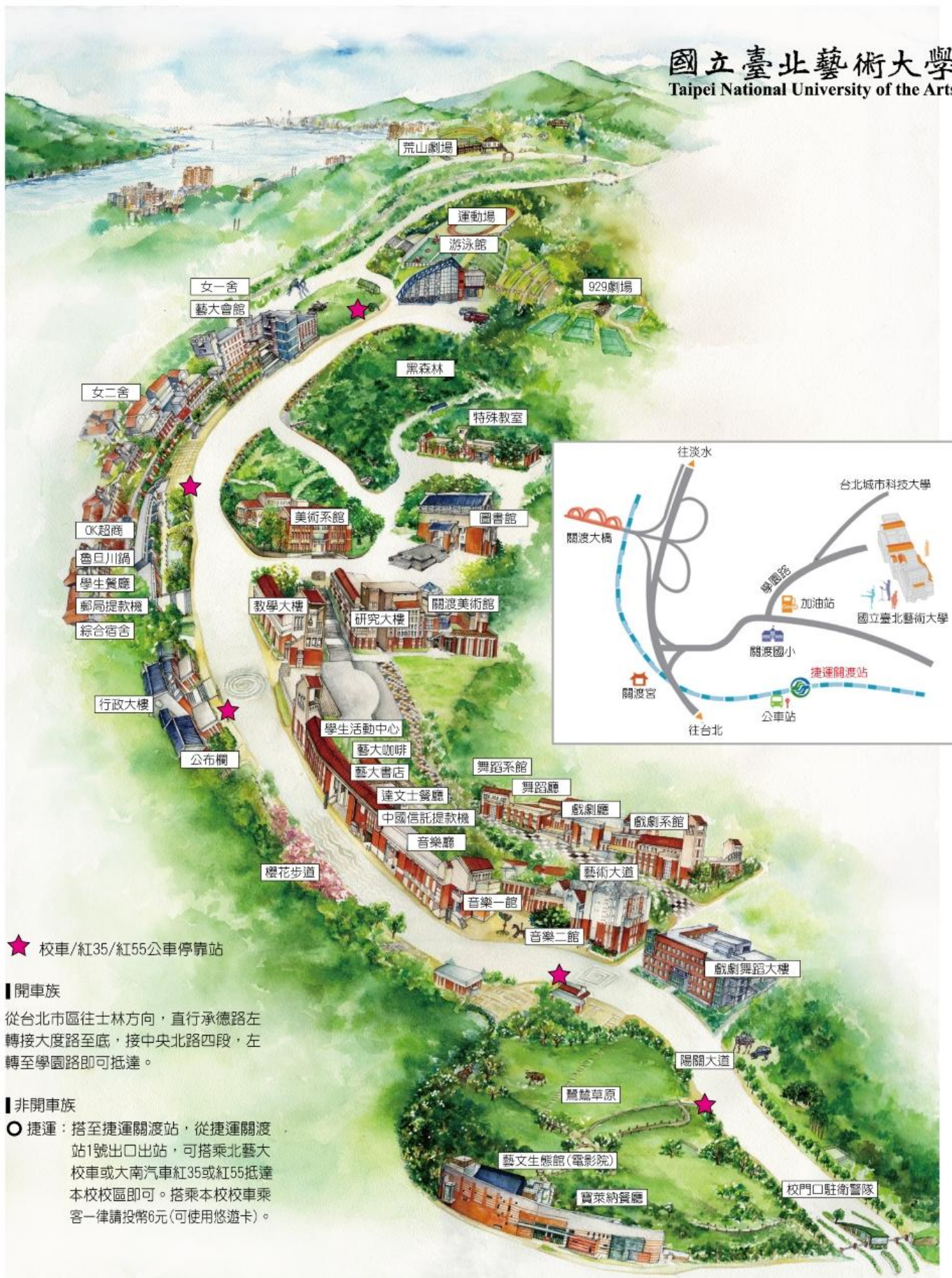
附圖一 本校交通情況及平面圖