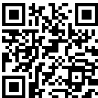
「Solid Edge 3D機構設計繪圖課程」夏令營報名表(團體)