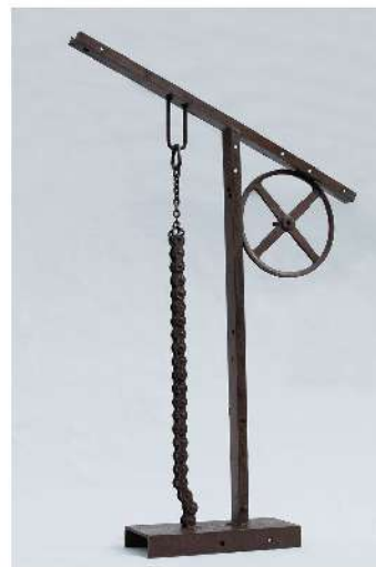
陳庭詩《超越，1990年代，鐵雕》

廖述昌先生對陳庭詩生平如數家珍，對於喜歡陳庭詩作品的聽眾而言，將會是場難得的藝術饗宴！