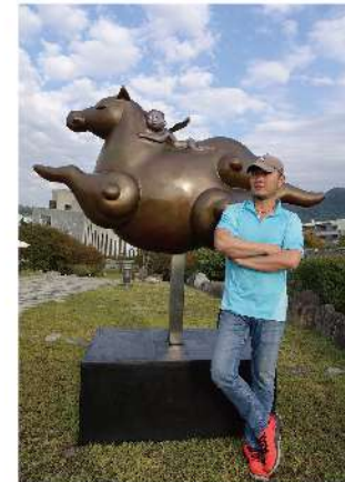
張也《夢飛翔》，2015，玻璃纖維材質