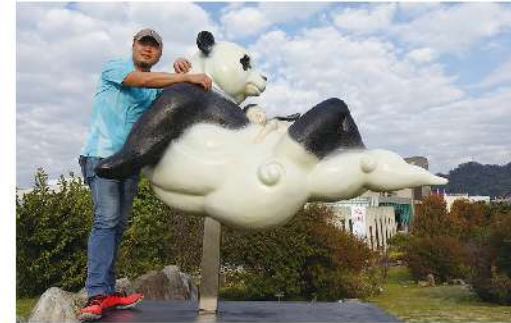
張也《夜未眠》，2017，玻璃纖維材質