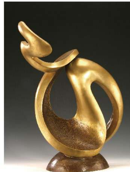
謝棟樑《衍生》，2008，銅材質

本講座播放1981年由臺灣省電影製片廠製作、謝棟樑老師演出的「刻刀·泥土·親情」(片長約30分鐘)，後續講座約1小時，結束後步行至「02雕塑空間」參觀。