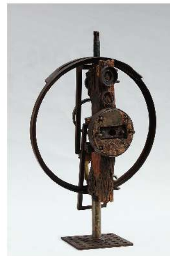
陳庭詩《作品662，1990年代，鐵雕》