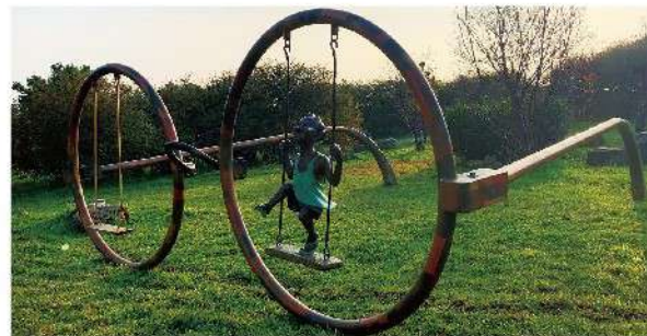
余燈銓《翻滾吧！視界·2014》