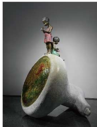
余燈銓《秘密的音響·2013》